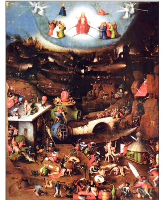
Hieronymus Bosch, Mitteltafel des Triptychons „Das Jüngste Gericht“

Mit Eurythmie und Lichtbildern aus dem Werk von Hieronymus Bosch