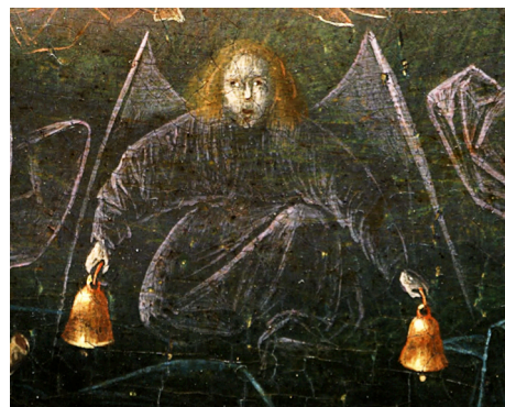
H. Bosch/ G. tot Sint Jans, Leben und Leiden des Johannes und seine Auferstehung, Details